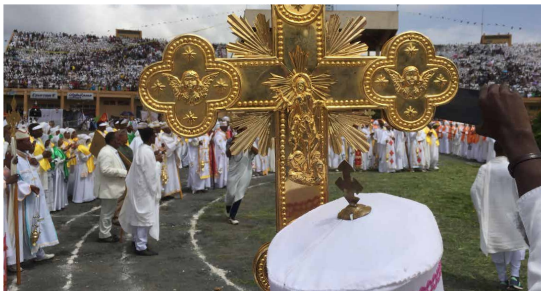
Meqelfest i Asmara.