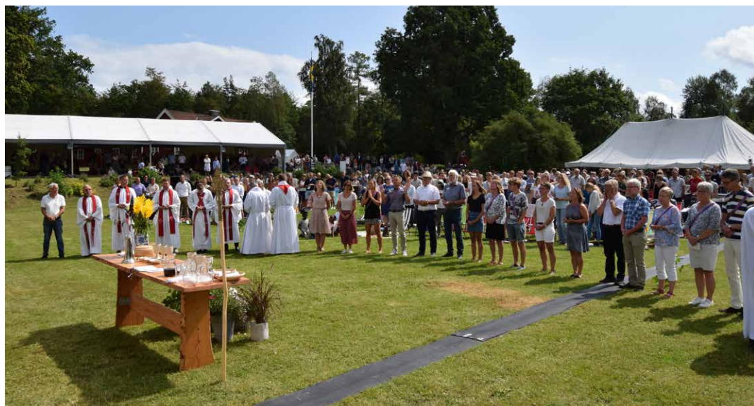
Nattvard under ELM Syds årsmöte på Breanäs missionsgård.