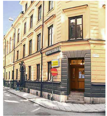
Roseniuskyrkan i hörnet Snickarbacken-Smala gränd

Genom åren har vi provat olika former för verksamhet under veckan. Hemgrupperna är ett viktigt komplement till den stora gudstjänsten. Vi har också samlats i en mellanstor grupp, i flera år under rubriken "vardag" med kvällsmat och lovsång runt ett föredrag eller bibelstudium. Vi har provat alphaskurs, bönefrukost etc. och kommer vara fortsatt frimodiga i att prova oss fram.