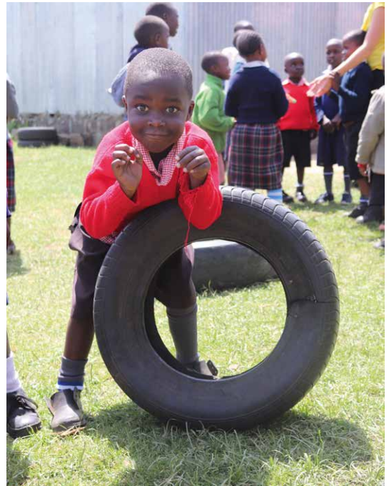
Barnen på BCMs skola har rast och leker på skolgården.