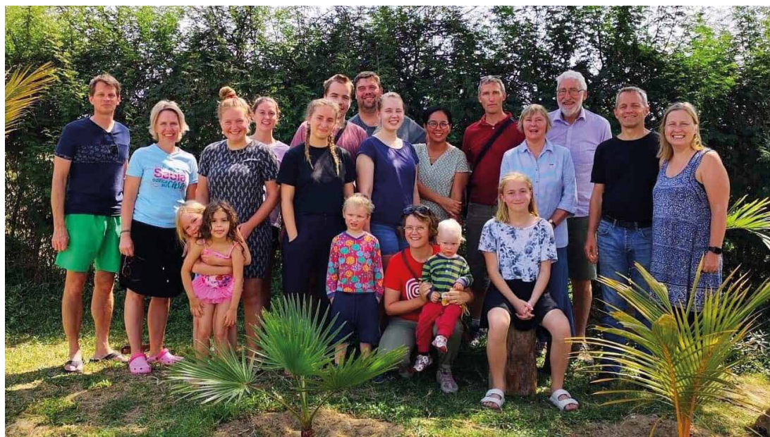
Missionärsdagar i Peru i november.