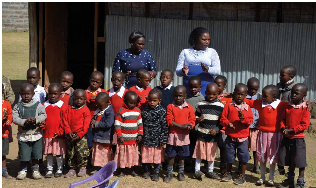
Små barn på Bethesda Children Ministry.

på BCM nu är verksamma som pastorer. Man sörjer över att ELCK fortfarande inte fungerar som en kyrka borde. ELCK visar inget som helst intresse och det Centrala stiftet, där BCM finns rent geografiskt, fungerar inte alls. Den utvecklingsorganisation som enligt tidigare uppgifter skulle fungera som rådgivande och ansvarstagande för ELCKs projekt har inte kommit igång. Trots detta visar BCM upp en imponerande god organisation som fungerar mycket väl och arbetar vidare utan att bli involverad i alla konflikter som pågår i kyrkan. ELM har här ett mycket välfungerande projekt som till alla delar förtjänar stöd och uppmuntran.