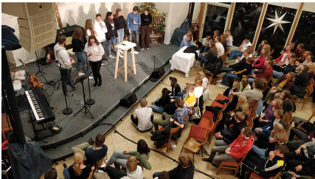
Nyårsläger på Strandhem och Solängskolan.