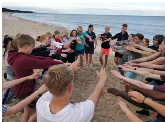
ELU-läger för konfirmander på Åhus missionsgård.

många ungdomar till undervisning, bön, sång och gemenskap.