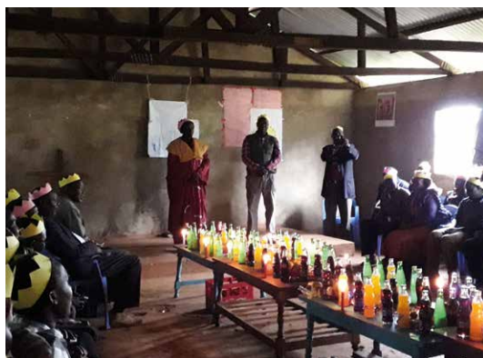
Kungens fest i slutet av försöningskurs.

visningsteamet. I april 2019 blev det så äntligen en verklighet.