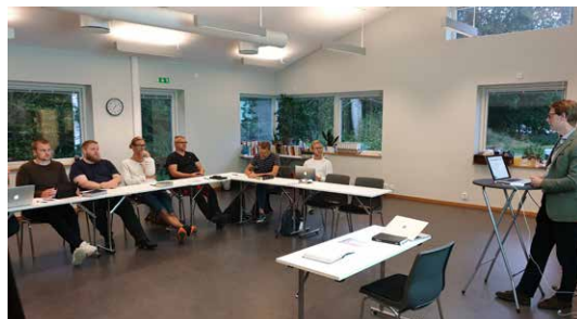
Utbildning för nya predikanter på Strandhem.

MIS anser det nödvändigt för missionen att nå barnen med budskapet om Jesus. Ett utförligt arbete krävs, oberoende av aktör.