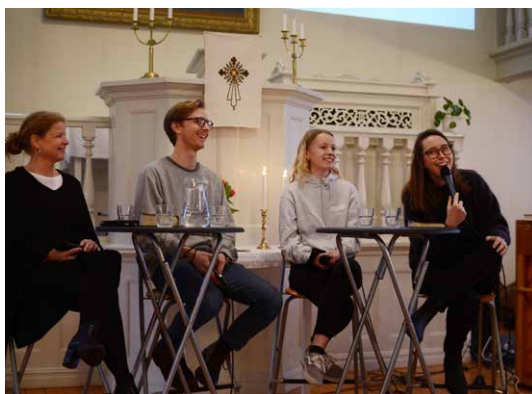
Pannelsamtal om bibelläsning under ELUs Vintermöte.