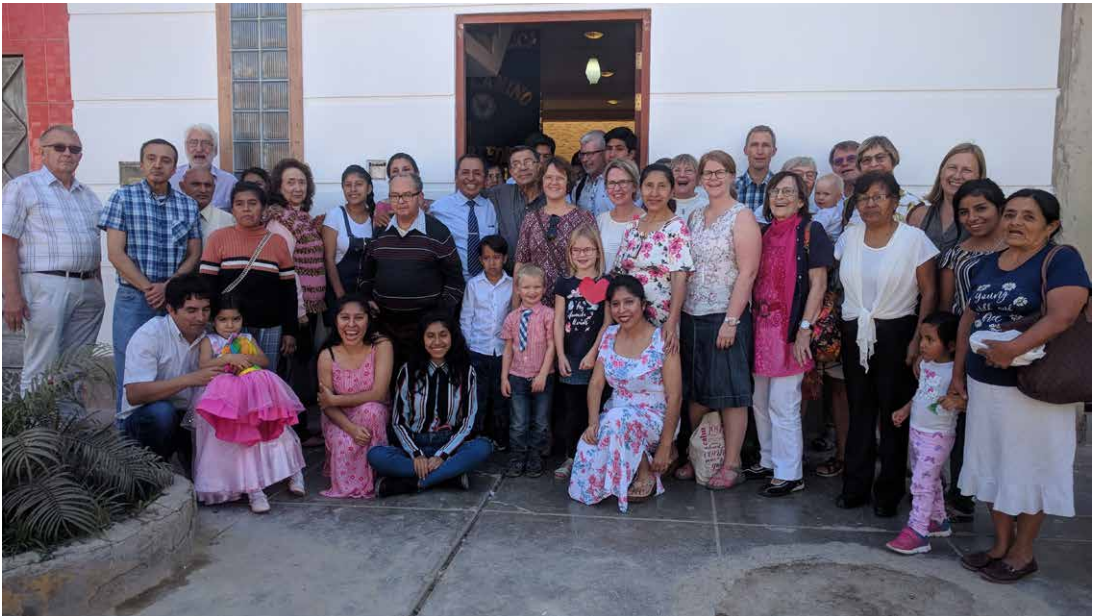
Gemensam gudstjänst i Las Brisas med resan från Sverige.