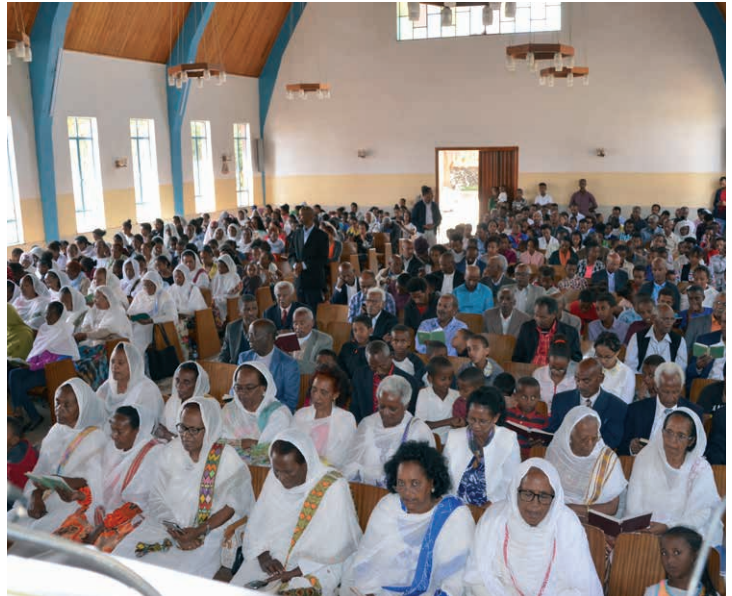
Fullsatt kyrka i Edaga Hamos i Asmara.