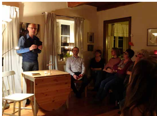
Stugmöte i Åkarp, Eket.

Målet är att upprätthålla mötesverksamhet på de platser där vi sedan tidigare är etablerade. Vi har en