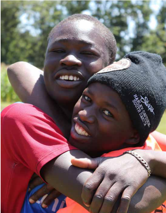
Kompisar i vått och torrt.