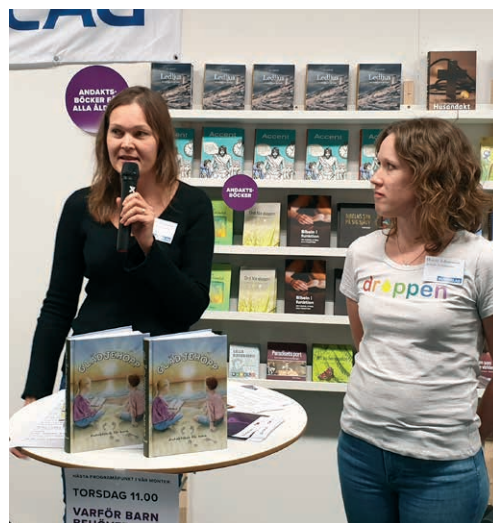
Föredrag i BV-förlags monter på Bokmässan i Göteborg i september.