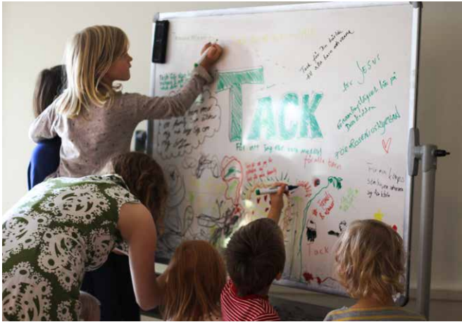
Bönestation i slutet av Roseniuskyrkans föreningshelg 2017.