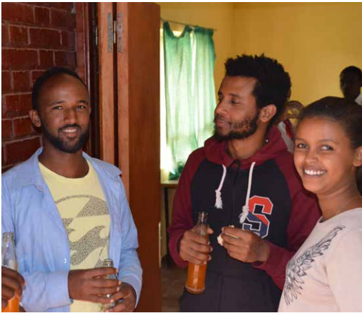
Nästa generation i EELC.