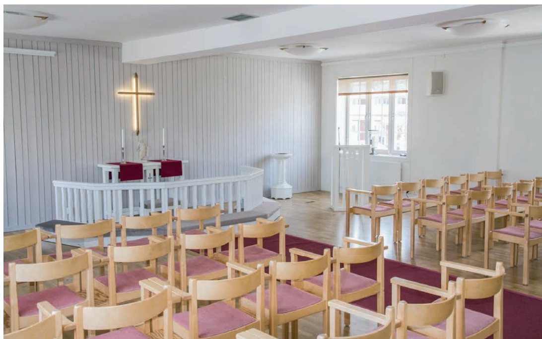
Interiören i Sackeuskyrkan i Umeå.