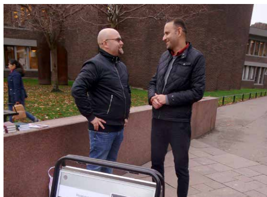
Gatuevangelisation i Helsingborg.

MIS har under 2019 förmedlat bidrag till följande verksamheter: