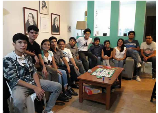
Studenter på ”Coffee and Game” i Piura.

År 2019 blev ett år med både stora utmaningar och stora välsignelser. Vi är så tacksamma för allt stöd och all hjälp från våra peruanska syskon i förbön och vi tackar ELM för moraliskt, ekonomiskt och andligt stöd och vägledning av kyrkan och dess pastorer och ledare.”