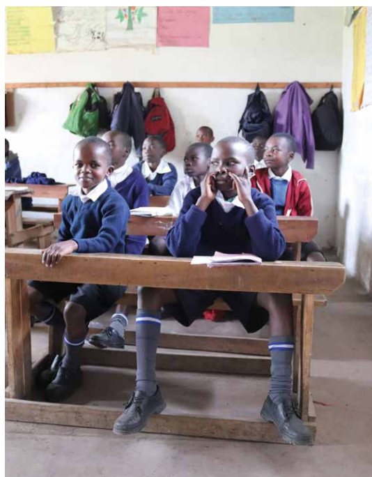
Flitiga barn i skolbänken på BCM.