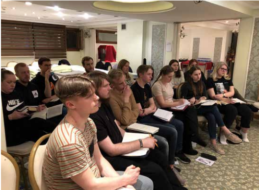
Deltagare på påsklägret i Främre Asien