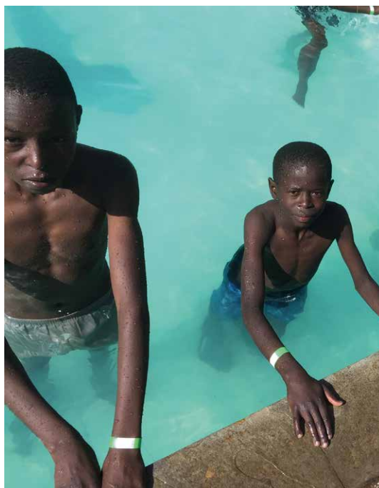
Barnen på BCM lär sig att simma.