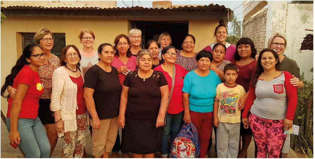
Deltagarna vid ELM resan till Peru besöker byn Luya.