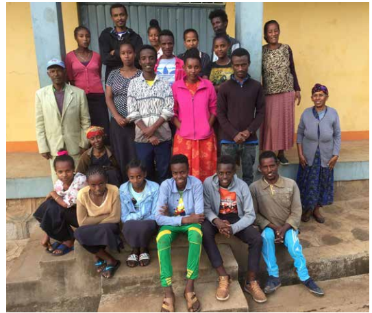
Personal och elever på ACYM.