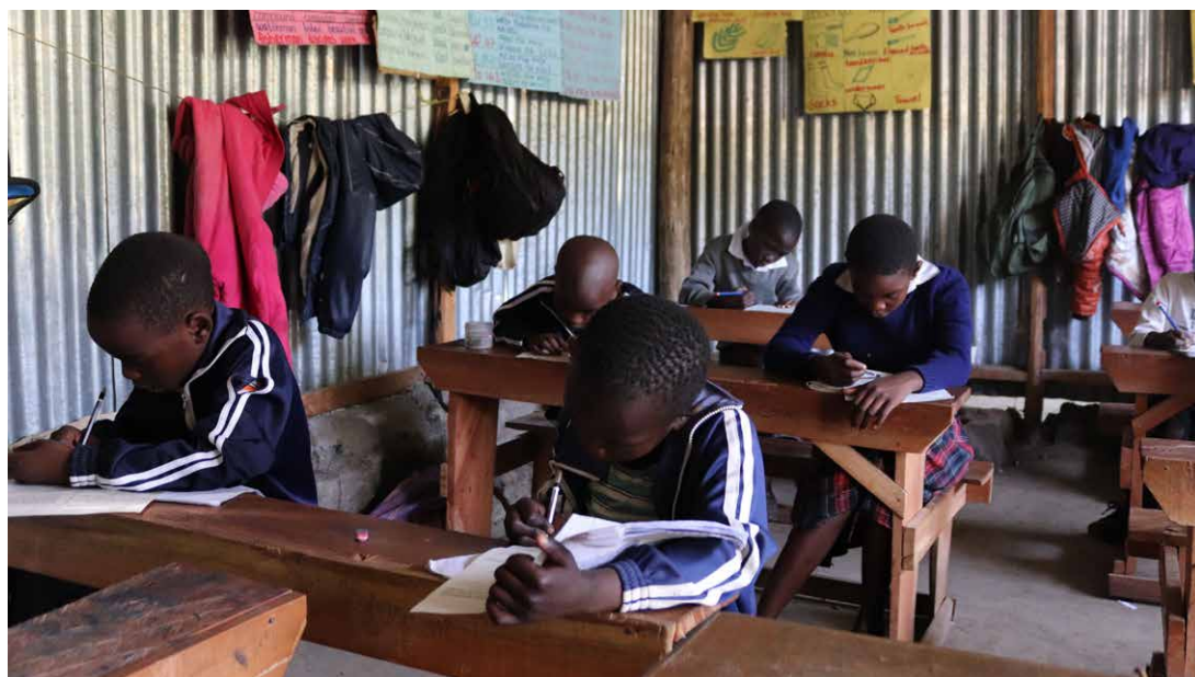
Flitiga studier i skolan på Bethesda.