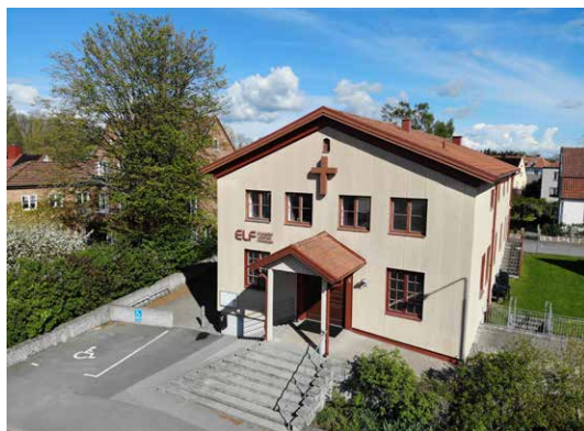
ELF-kapellet i Kristianstad.

Trots allt är det ju relativt angenäma problem vi brottas med. Vi får tacka Gud för en stor förening