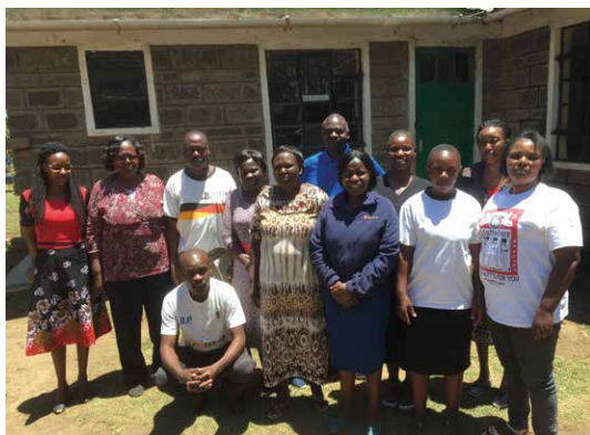
Personalen på Bethesda.