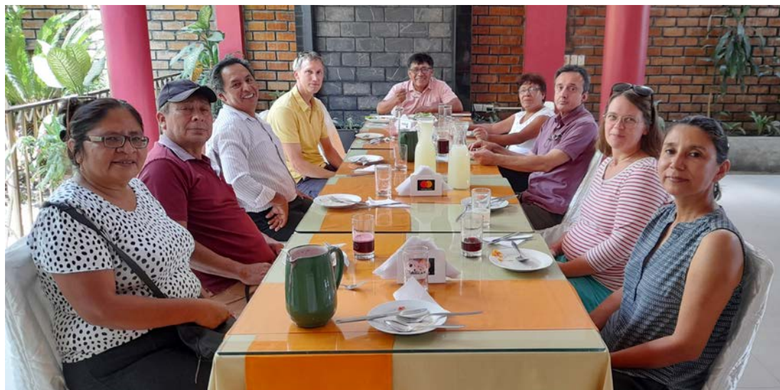
Samtal med IELCHs styrelse och pastorer.