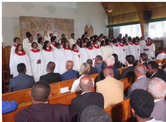
Flera körer medverkade under jubileet och sångglädjen var stor!