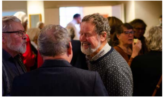
Deltagare vid bibeldag på Strandhem.

För att hålla en så stor anläggning som Strandhem är, behövs kompetens inom många områden. Vi försöker att hålla vår gård i gott skick, ofta får vi också bekräftelse från våra gäster att gården håller en god standard. För att vi ska klara av att hålla den