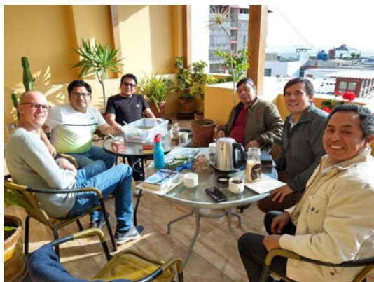
Samling med kyrkans pastorer och predikanter.