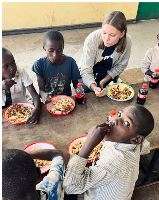
Måltid på Bethesda.