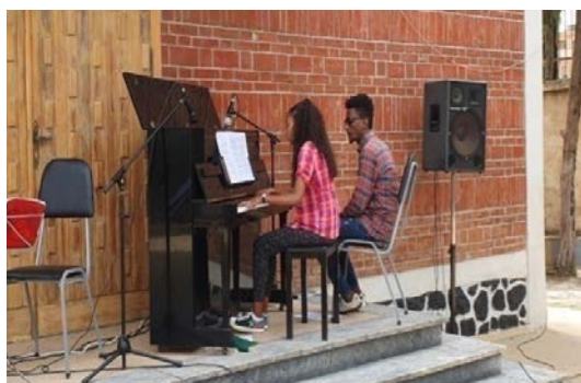
Student vid musikskolan i Asmara.

På grund av pandemin, renovering och verksamhetsuppggradering var musikskolan stängd i nästan två år. Musikskolans faciliteter har renoverats och vi har arbetat med att uppgradera läronivån. Den fysiska och innehållsmässiga renoveringen gjorde att årets kurser, som egentligen skulle påbörjats i januari 2022, i stället började i april. Efter ett så långt uppehåll var det inte helt enkelt att starta i gång verksamheten igen. I maj var det dock 90 studenter på skolan, varav 45 var helt nya. Vi kunde hålla en avslutningskonsert i juli i Edagahamus-kyrkans byggnader. I augusti ansökte nästan 200 elever till skolan, men i brist på fler musikinstrument kunde vi bara anta 46 av dem. I september, som är starten på en ny termin, hade vi 132 studenter vid skolan. Vi längtar efter att kunna ha fler studenter, men behöver då fler akustiska gitarrer och pianon.