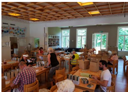
Här packas för fullt. Boken om Hopp (Nya testamentet med personliga vittnesbörd) delas sedan ut i samtliga brevlådor i Vännäs.

2022 avslutades med återträff för de fyra senaste konfirmand-årgångarna som övergick i nyårsläger för hela familjen. Till stor glädje och uppmuntran deltog ett 50-tal tidigare konfirmander i återträffen och på lägret var deltagarantalet stundtals närmare