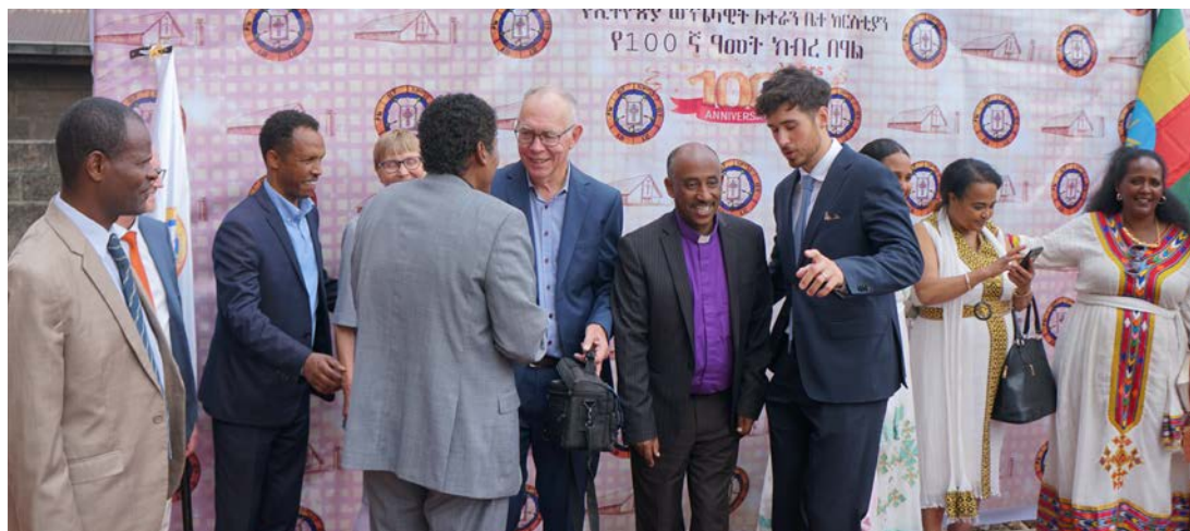
Hundraårsfirande i Addis Abeba.

personlig kontakt med representanter för 31 olika föreningar och församlingar.