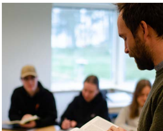
Undervisning på bibelskolan.

Missionsakademins verksamhet, som är ett samarbete mellan Missionsgården Strandhem och Johannelunds teologiska högskola, fortlöpte under 2022. De kurser som hållits har varit den missionella kyrkan & teologi och praxis, religioner och livsåskådningar i Sverige idag, samt introduktionskurser