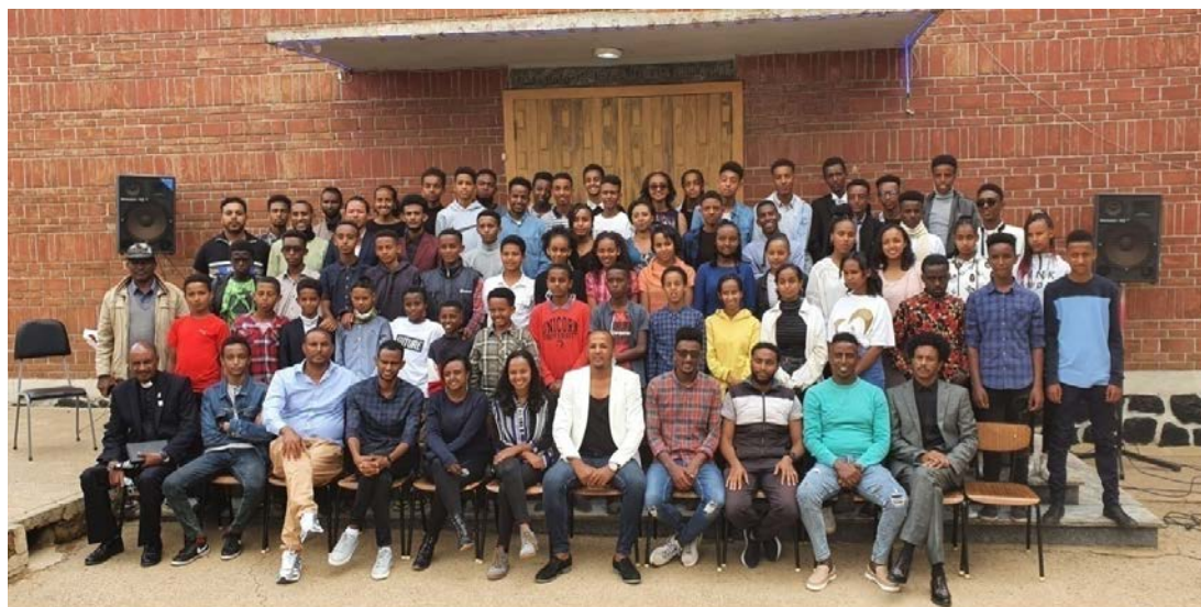
Studenter och lärare tillsammans med kyrkans president vid avslutningsceremonin i juli 2022.