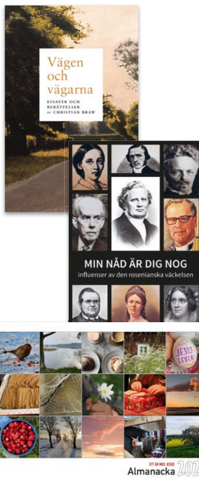
En del av BV-Förlags utgivning under 2022.