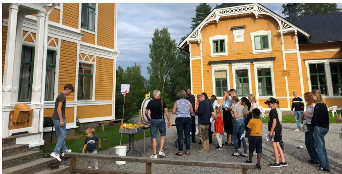
Kö till chokladjulet. Ett nytt sätt att samla in pengar till missionen?