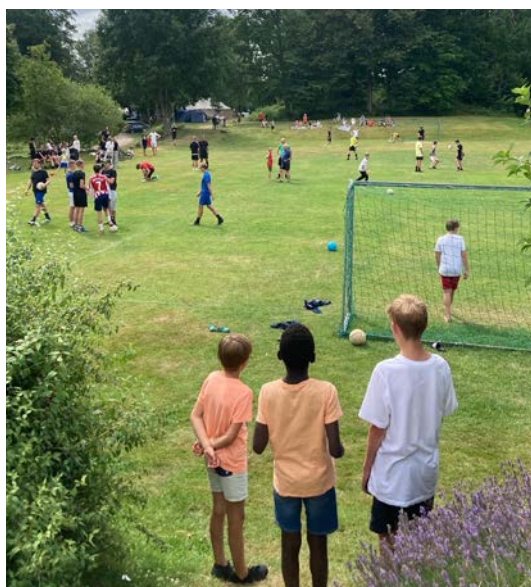
Sport för alla åldrar.

Under 2022 var verksamheten i full gång igen efter pandemin, såväl egna arrangemang som extern uthyrning. Ekonomin har varit god, trots skenande elpriser och ökade kostnader. Nu ser vi fram emot att äntligen kunna genomföra ett förrådsbygge. Det har stått på önskelistan länge och inom en snar framtid kan det bli verklighet. Vi har även funderat på hur vi skall kunna få ner elkostnaderna och landat i att konvertera till ett vattenburet system samt en luft/vatten-värmepump.