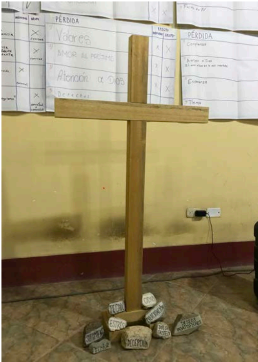
Amaniworkshop i Chiclayo.