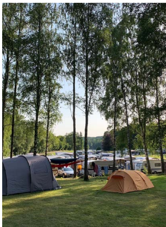
Bibelcamping i ljuvligt sommarväder.