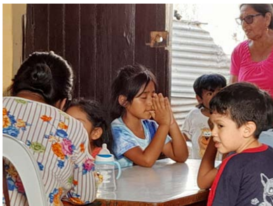
Evangeliserande barndagar i Las Lomas och San Antonio.