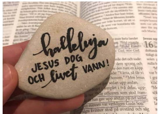
En minnessten som varje deltagare fick med sig hem från påsklägret.

god knytismat och fina samtal där vi återigen fick ta del av starka livsöden från våra kristna syskon. På eftermiddagen var vi på Hamam (lokalt badhus) och fick uppleva en ångande varm gemenskap mellan skrubb och lödder. Vi var många som kände att det här är ett koncept vi borde ta hem till Sverige! Avslutningsmiddagen blev en lyxig (men fortfarande billig!) 3-rättersmåltid i en restaurang med utsikt över vattnet. På kvällen hade vi en fantastisk stund i Guds och varandras närhet då vi delade vad vi fått under veckan och vad vi vill sända med varandra. All ära till Gud för vad Han har gjort med oss den här veckan. Vi har fått ta del av både fin undervisning och inblickar i hur de utsända i landet lever ut Guds kärlek i praktiken. Detta har inspirerat oss alla enormt mycket. Det var fantastiskt att på nära håll få uppleva området, människorna och kulturen. För oss som var med denna gång har det