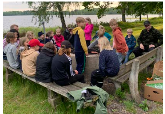
Avslutning med Missian Kids på Missionsgården Strandhem.

ner Herren Jesus. Och hur står vi med i det nationella och internationella missionsarbetet? Genom vårt arbete når vi idag en del barn och ungdomar utanför föreningen, men vi ber om ledning att nå fler och att nå vuxna. Vi ber med psalmisten: Visa oss, Herre, din väg, vi vill vandra i din sanning (Ps 86:11).