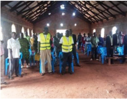
Fredswerkshop i Sondu.