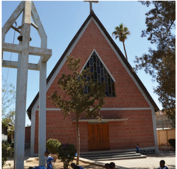
ELCEs kyrka i Asmara, tidigare Lutherska kyrkan, byggd av Sture Bengtsson.

Samarbetskyrka: Evangelisk-Lutherska kyrkan i Eritrea (ELCE) Adress: P.O.Box 905. Asmara, Eritrea Telefon: 00291 11 20 711