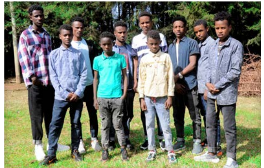
Flickorna och pojkarna på ACYM.

ten av världen skenat. Allt detta har förstås påverkat levnadsstandarden i landet och levnadskostnaderna har ökat avsevärt. På ACYM kämpar man med att få pengarna till att räcka och skulle gärna vilja göra mer om de hade mer pengar. Personalen har ganska låg lön i jämförelse med andra organisationer och det gör att det ibland är svårt att motivera personal att fortsätta arbeta på ACYM. Verksamheten har ändå, trots ekonomiska utmaningar, kunnat fortgå, till stor del på grund av det bidrag faddrarna är med och ger. ACYM ligger på en stor tomt så det finns många möjligheter till olika lokala inkomstkällor vilket de också jobbar med. Det finns några mjölkkor på tomten vilket gör att man inte behöver köpa mjölk. De säljer även mjölk för att täcka kostnaderna för foder till korna. Ibland blir det också pengar över från mjölkförsäljningen som går till verksamheten. ACYM önskar att bygga en permanent byggnad för korna så att de kan skötas ännu bättre och kanske ge mer inkomster till projektet.