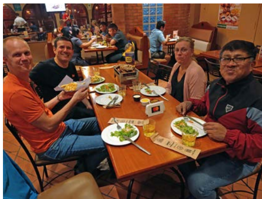
Lunchpaus under renoveringsdagar i Piura.

Att samla 60 personer i kyrkans regi har inte varit möjligt på grund av pandemin och det var länge sedan kyrkan som helhet var samlade på ett läger som detta. Det fanns en påtaglig glädje hos deltagarna, som var både unga och gamla, över att vara tillsammans. Det var inte bara kyrkans folk som var med, några ungdomar från kyrkans studentcafé Coffee & Game deltog också. Likaså en kyrkmedlems kollega och några studenter som aldrig varit med i kyrkan innan hade anmält sig. Ett av vittnesbörden från en av dessa var att hon hade känt sig välkommen även om hon inte kände någon och ingen kände henne. Från att i början inte riktigt hinna med att hitta bibelorden i den lånade Bibeln till att nästan vara först med att hitta i slutet på workshoppen var fantastiskt att se. Gud jobbar ju på olika sätt med olika människor – hon hade glömt sina glasögon och var därför tvungen att sitta längst fram och hennes fokus var imponerande. Be för denna kvinna att ett frö av evangeliet ska ha såtts och att den Helige Ande ska arbeta vidare i henne.