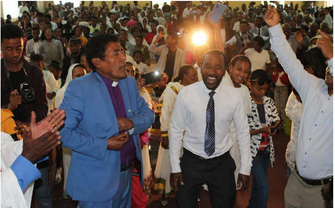
Glädjefylld hundraårsfest i Asella.