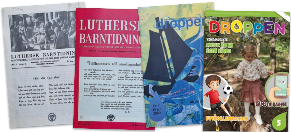
Framsidor genom tiderna, från vänster: nr 1-1952, nr 1-1972, nr 3-2000 och nr 5-2022.

En av läsarna berättar: ”Det var roligt att få läsa berättelserna. Att få läsa olika berättelser om barn i olika situationer stärkte min upplevelse av att Jesus älskar mig och vill va min vän och hjälpa mig, att han ger förlåtelse och att Gud hör bön. Det känns så fint att denna kristna tidning får fortsätta sprida budskapet till barnen om Guds kärlek till alla och Jesus som världens Frälsare.”